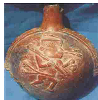
Figura 1. Cerámicas del Estilo Pativilca. Museo de Arqueología de la UNJFSC. Museo de Historia de Paramonga.