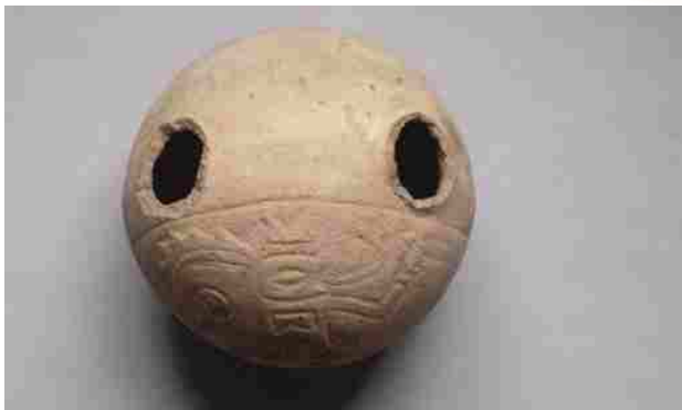
Figura 2. La botella está decorada con dos figuras similares pero una de ellas es ligeramente de mayor dimensión

“En el año de 1980, estando como Rector de la Universidad el Dr. Manuel Acosta Jurado, se promovieron actividades que tendían a elevar el nivel académico y cultural de la Institución. Se puede citar, por ejemplo, la fundación del Centro de Investigación