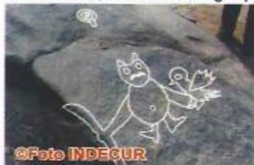
Chavín 2,809 años antig.