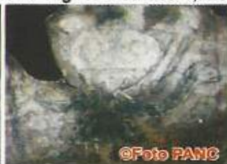
Tiahuanaco 2,709 años antig.