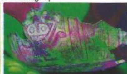
Cerámica Estilo Pativilca 1,209 años antig.