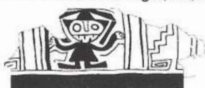
Fig. 02 Pativilca 4,220 años antig. aprox.

Ventarrón-Lambayeque Murales 4,000 años de antigüedad Contemporáneo a Caral