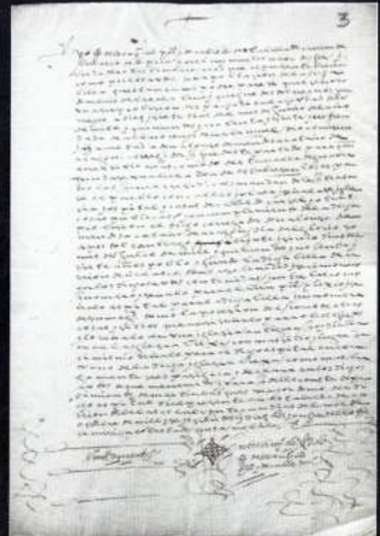
FUNDACIÓN DE HUAURA FUÉ EL 25 DE JULIO DE 1597 Y NO EL 17 DE ENERO (archivo del Obispado de Huacho/serie: curatos, legajo: 01, fecha extremas: 1600 -1644/exp.: 02-efio 1600, folio: 08)