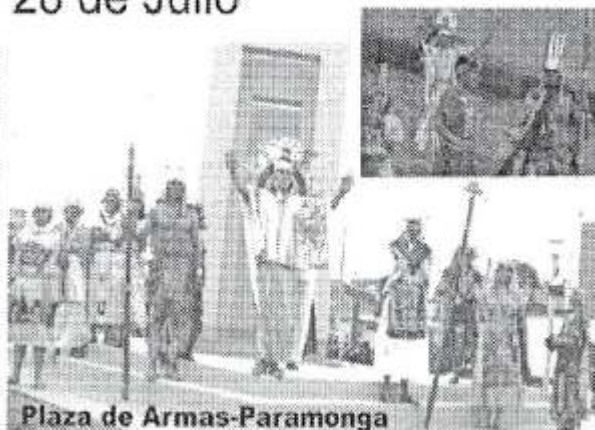
Plaza de Armas-Paramonga