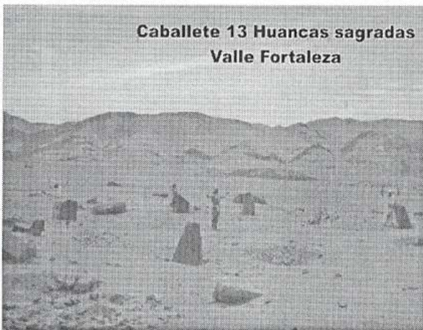
Caballote 13 Huancas sagradas Valle Fortaleza