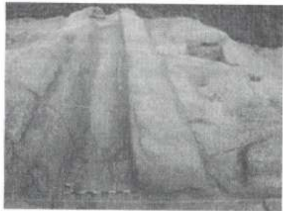
Figura: Vista del pasadizo del lado Sur.