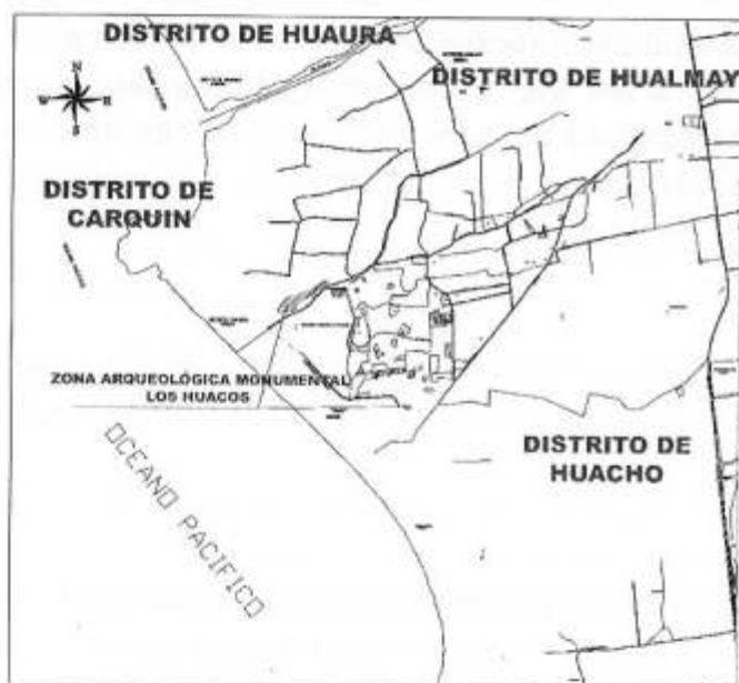
Figura 1: Plano de ubicación del complejo arqueológico Hualmay.

Ubicado hacia el lado Oriental del complejo. Está conformado por los montículos del 29 al 36. (...)