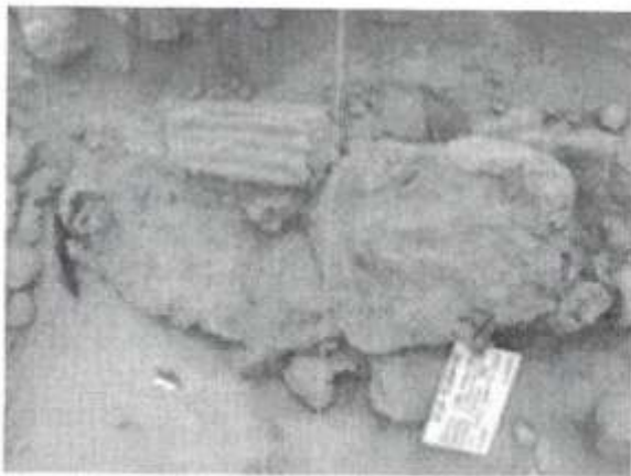
Figura: Vista del contexto funerario en detalle.