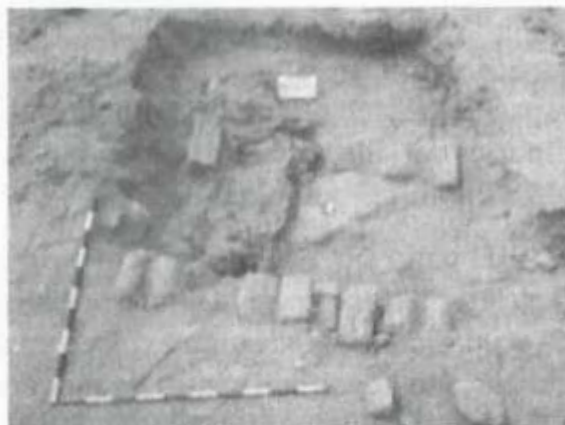
Figura: Superior. Vista del contexto funerario de la tejedora.