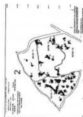
Figura 2: Plano del Complejo Arqueológico Hualmay con los montículos conformantes.