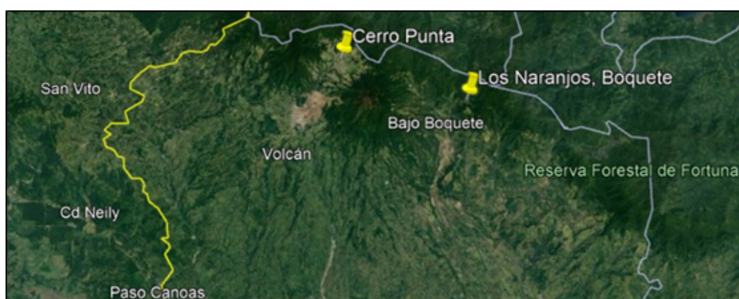
Figura 4 Distribución de Bipalium kewense en Panamá